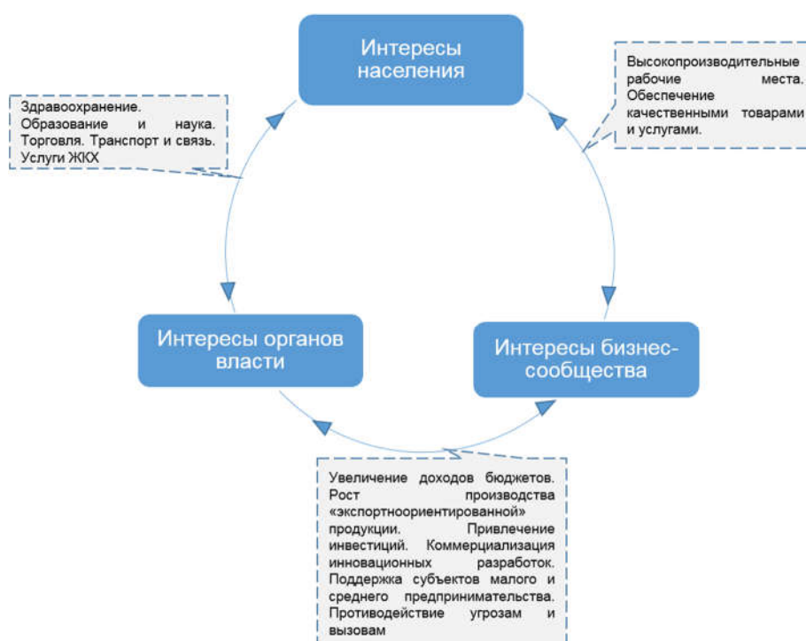
Баланс интересов населения, бизнес-сообщества и органов власти

В значительной степени выбор приоритетных видов экономической деятельности состоит в определении тех из них, осуществление которых в наибольшей степени соответствует балансу интересов населения, органов власти и самого бизнеса. Схематично баланс интересов триады: население Югры – бизнес-сообщество – органы власти – показан на рисунке.